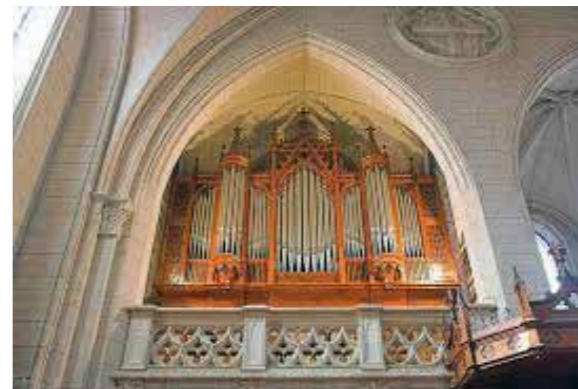
ORGUE DU TEMPLE DU SALIN